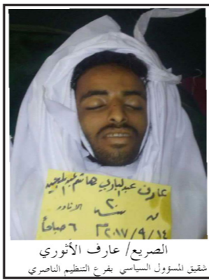
الضريح / عارف الأثوري شقيق الشئون السياسي بفرع التنظيم الناصري

لقي عدد من مرتزقة العدوان مصرعهم الأسبوع الماضي على أيدي أبطال وحدة القناصة في الجيش واللجان. حيث تم قنص 6 في منطقة الهاملي بمديرية موزع و2 في بئر باشا غرب مدينة تعز و2 في كلبه وواحد في وادي صالة شرق المدينة وواحد شمال شرق مديرية المخا.