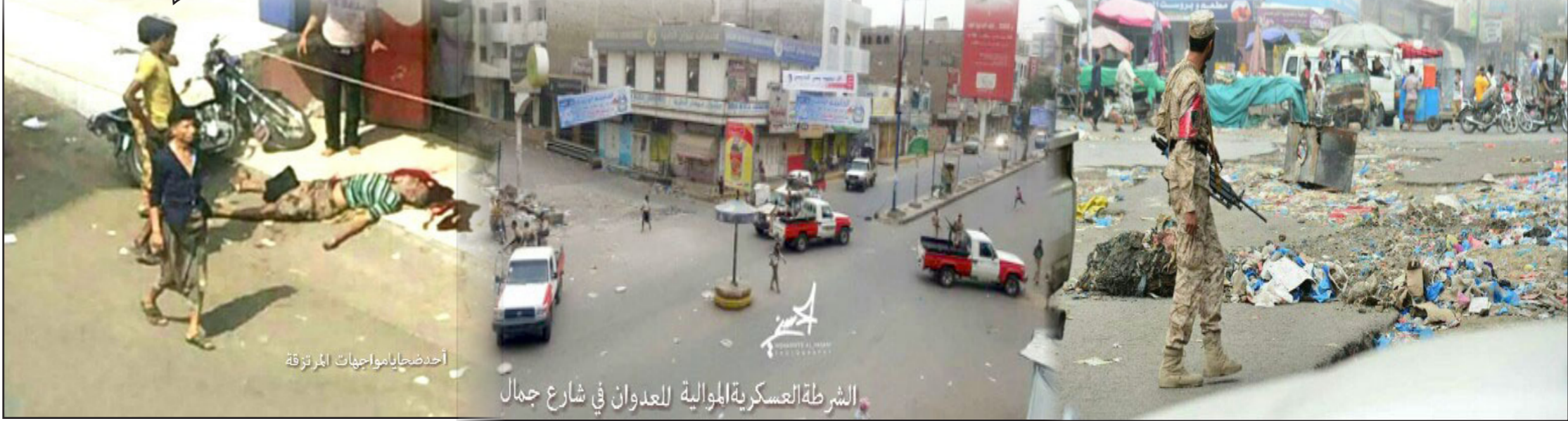
أحد صغار مواهب المهرجة