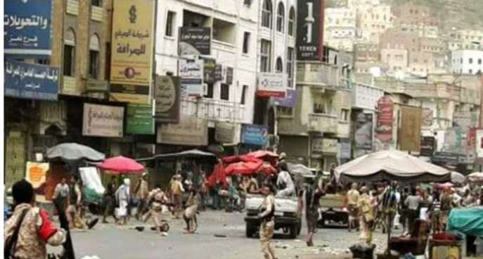
محيط سوق دي لوكس

تواصلت المواجهات المسلحة السبت الماضي في مدينة تعز لليوم الخامس على التوالي بين الميليشيات التابعة لمرتزقة العدوان والتي كانت قد اندلعت الثلاثاء الماضي من جديد في شارع جمال وسوق دي لوكس وسط المدينة بسبب الخلافات على جباية إيرادات سوق القات.. وفشلت كل المساعي والمحاولات من قيادات المرتزقة في احتوائها.