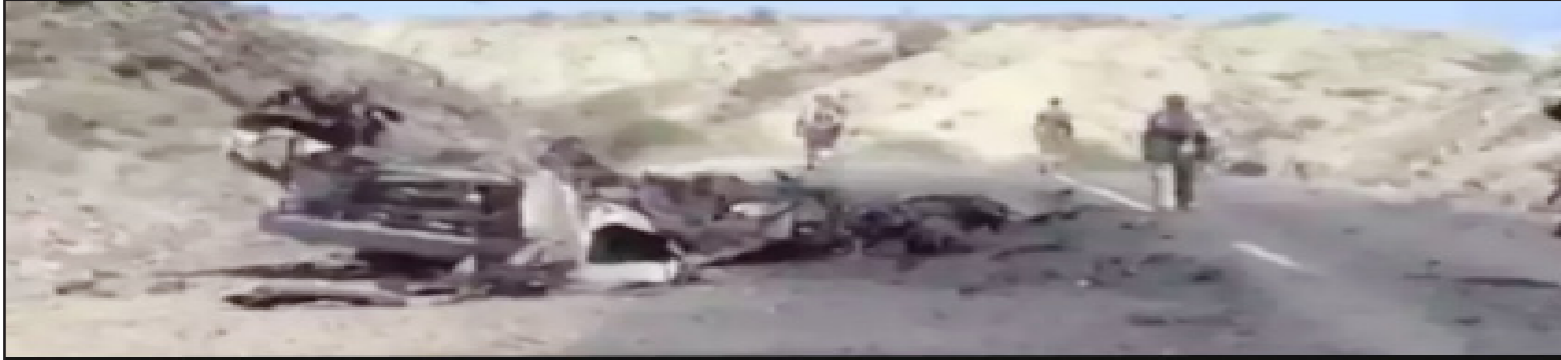
مدرعات وعربات المرتزقة في جبهة ذوباب-المنذب

واصل ابطال الجيش المسنودون باللجان الشعبية في مختلف الجبهات بمحافظة تعز ومديريتي المضاربة والقبيلة التابعتين لمحافظة لحج خلال الاسبوع الماضي تصديهم للزخافات والمحاولات المتكررة التي ينفذها مرتزقة تحالف العدوان السعودي والمعززون بأحدث أنواع الأسلحة الخفيفة والمتوسطة والثقيلة والمسنودون بغطاء جوي وبحري مكثف من قبل الطيران والبوارج والسفن والزوارق الحربية التابعة لتحالف العدوان. ففي المحور الغربي لمحافظة تعز ولحج أفضل ابطال الجيش واللجان أكبر مخطط لاحتلال محافظة تعز عبر الانزال البحري في سواحل المخا وذوباب والزخافات البرية من مديرية المضاربة بمحافظه لحج باتجاه ذوباب والوازعية، ومن كرش بمديرية القبيلة باتجاه الشريجة والراهرة ورغم الاسناد الجوي المكثف من قبل طيران تحالف العدوان والتعزيزات العسكرية الكبيرة التي دفع بها تحالف العدوان ومرتزقته الى كافة الجبهات في المناطق التابعة لمديريات المضاربة والمقاطرة وصور الباحة والقبيلة بمحافظة لحج والمحاذاة لمديريات حيفان والوازعية وذوباب والى مدينة التربة والنشمة ووادي الضباب والمتمثلة بالذائر والأسلحة الخفيفة والمتوسطة والثقيلة والمقاتلين من ميليشيات حزب الاصلاح والجماعات السلفية المتطرفة والمنشقين من الجيش والأمن المواليين للعدوان والشباب المغرور بهم الذين تم تجنيدهم في معسكرات المرتزقة بعدن والعند وما يسمى المقاومة الجنوبية ومن تنظيمي داعش والقاعدة اليمينية والاجانب، فقد تصدى ابطال الجيش لكافة الزخافات وأفشلها جميعاً مكبدين المرتزقة المزيد من الخسائر الفادحة في الأرواح.. «الميثاق» رصدت في التقرير التالي مجمل الأحداث والتطورات الميدانية التي شهدتها محافظة تعز وجبهات المواجهة في محافظة لحج.