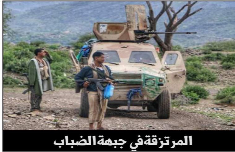
المرتزقة في جبهة الضباب