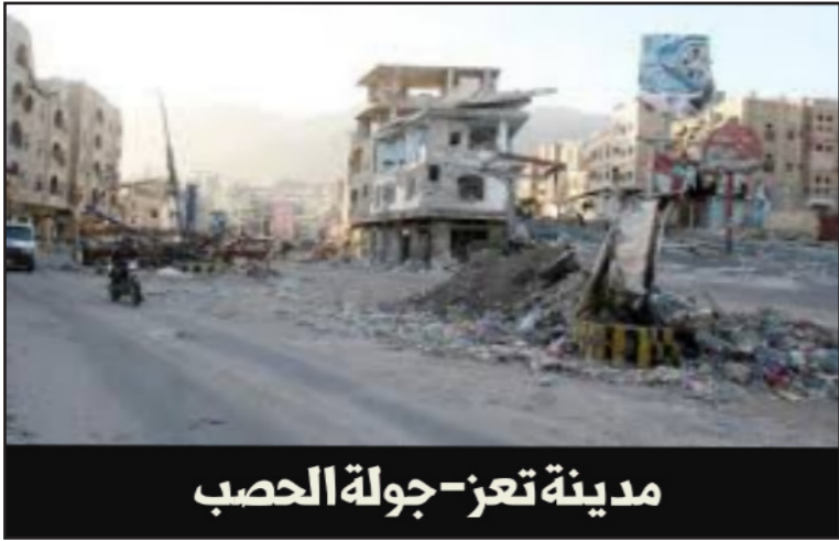
مدينة تعز- جولة الحصب