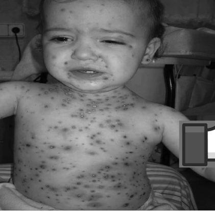
احمد فرحان - عارف الضياني