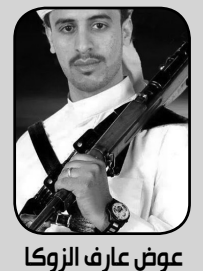
غوض عارف الزركا

هاهو الثاني والعشرون من مايو المجيد ياتينا بطلته الجديدة بعد 26 عاماً. هذا العيد الذي لم الشمل ووحدنا بعد تضحيات لن ينساها التاريخ والتقى ابنا الجنوب وابناء الشمال في هذا اليوم المجيد واصبحتنا جسداً واحداً لا يفترقنا احد. ولكن هانحن اليوم نمر بأسوأ الأحوال في وطننا الغالي حيث تواجه أكثر من عدوان في كل نواحي الوطن.. وهاهم أفراد من الجنوب يطالبون بالانفصال على الرغم من أننا نقف الى جانب القضية الجنوبية بكل متطلباتهم ولكن نؤكد لهم ان الانفصال ليس الحل لانه سوف يؤدي الى مزيد من التشتت والتفرقة والعنصرية والافتتال ولا ننسوا ذكرى 13 يناير 1986م المأساوية .. نؤكد أننا سوف نضحي من اجل الوطن كما ضحينا في الماضي وان الوحدة اليمنية سوف تظل هي مشروعا الاكبر بعد ان يتم التخلص من جميع أعداء الوطن. حفظ الله اليمن وأهل اليمن وتاريخ اليمن ووحدة اليمن. كل عام وانتم بالف خير