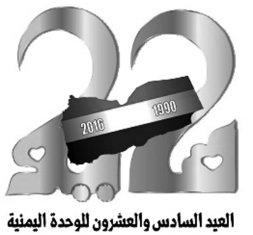
العيد السادس والعشرون للوحدة اليمنية