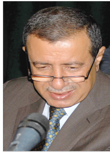
بقلم الشيخ/ صادق امين أبو راس نائب رئيس المؤتمر

خيانة الوطن.. أعظم وأكبر مما تحتمله أي نفس ويجمع كل الناس على مقت الخائن فكل فعل مشين يمكن للمرء أن يجد مبرراً له إلا خيانة الوطن.. فإننا لن نستطيع أبداً أن نجد لها مبرراً. أيما كان السبب الذي يدفع الخائن لهذا الفعل المشين فلا يمكن أن يشفع له بيع وطنه.. لذا يغدو عند الناس خانناً.