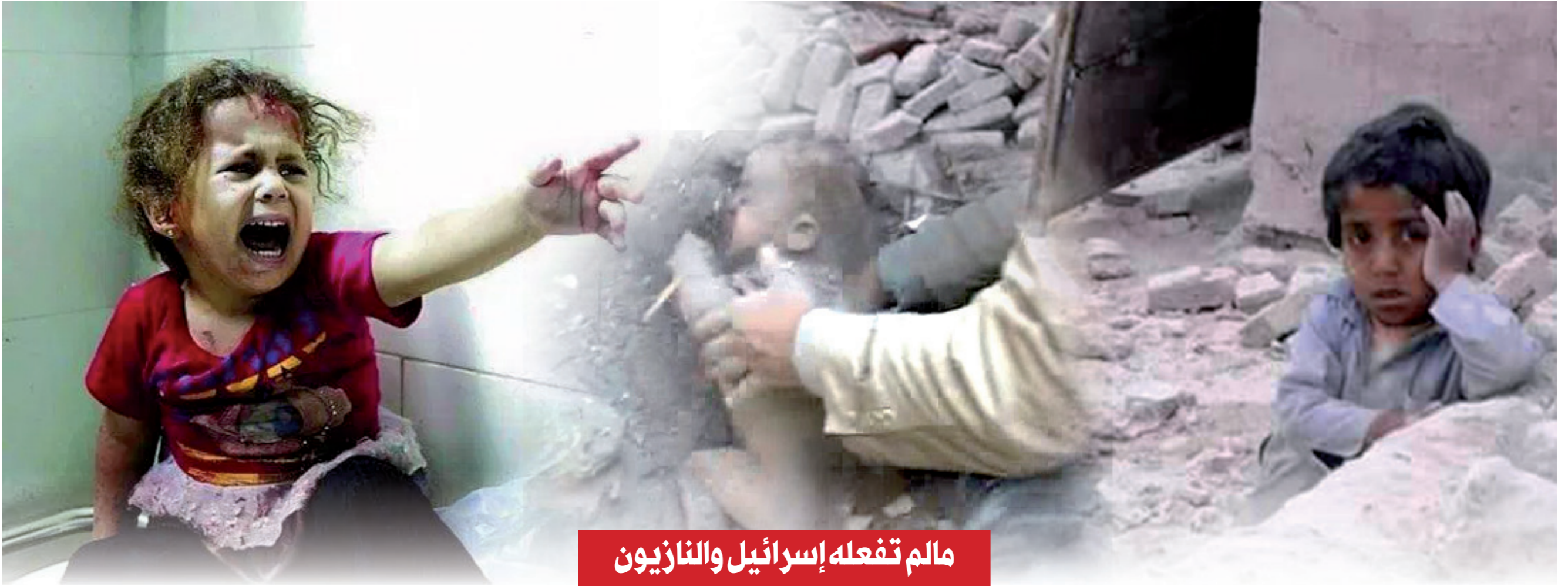
مالم تفعله إسرائيل والنازيون