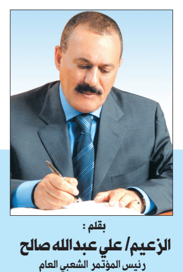
يقلم: الزعيم/ علي عبدالله صالح رئيس المؤتمر الشعبي العام