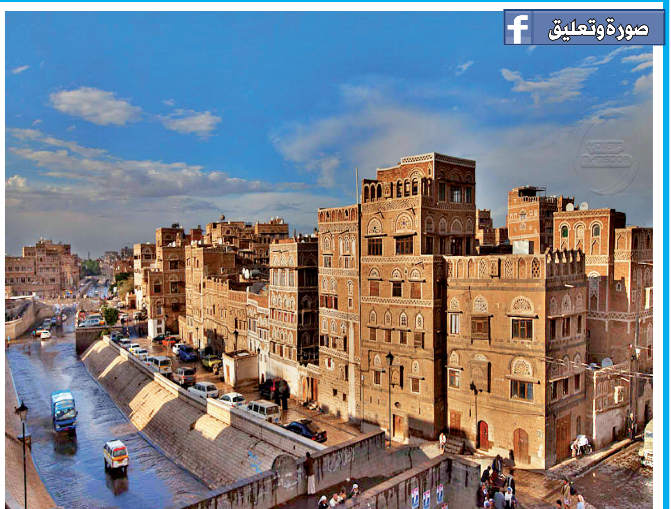
علي عمر الفلاحي

صنعاء مدينة الجمال والحب والحرية احموها ولا تدمروها ابنوها ولا تخربوها