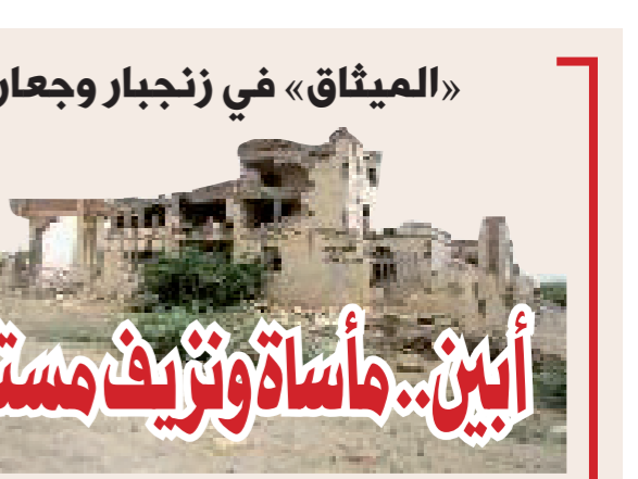
«الميثاق» في زنجبار وجعار

استقبل الزعيم علي عبدالله صالح - رئيس المؤتمر الشعبي العام - أمس، قيادات وأمناء أحزاب التحالف الوطني الديمقراطي.. جرى خلال اللقاء مناقشة المستجدات على الساحة الوطنية وما تم تنفيذه