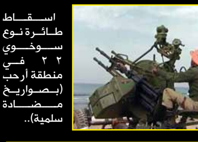
سقوط طائرة نوع سوخوي في منطقة أرحب (بصواريخ مضادة سلمية)..