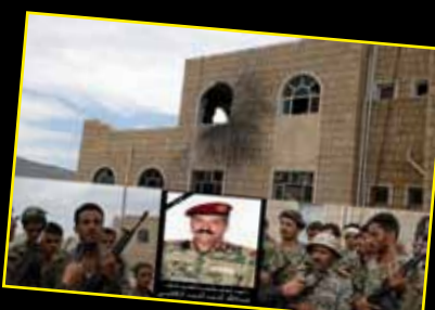
ضرب اللواء ٦٣ مشاه جبلي وقتل قائده ومجموعة من الضباط والجنود..

تستمر الفعاليات السلمية حيث تم خلال الأربعة أيام: