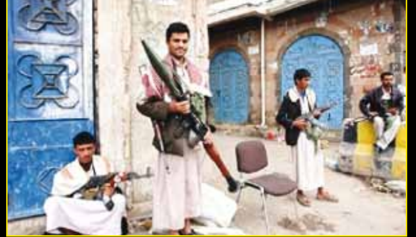
فهل يعي الشباب الذين يحملون جميع أنواع الاسلحة السلمية في ساحة السلمية.. كيف سقط هؤلاء!!