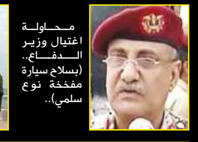
محاولة اغتيال وزير الدفاع.. (بسلاح سيارة مفخخة نوع سلمية)..