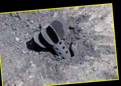
ضرب الامن المركزي بقذيفة هاون نوع (سلمية سلمية)..