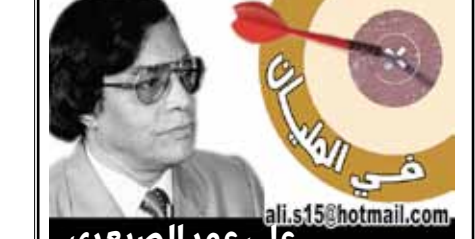
علي عمر الصيعري

الشعب كل الشعب أنصار الرئيس علي عبدالله صالح الديمقراطي والحرية، والشعب كل الشعب أنصار الوحدة والأمن والاستقرار. وكل ما يريده الشعب من الرئيس علي عبدالله صالح