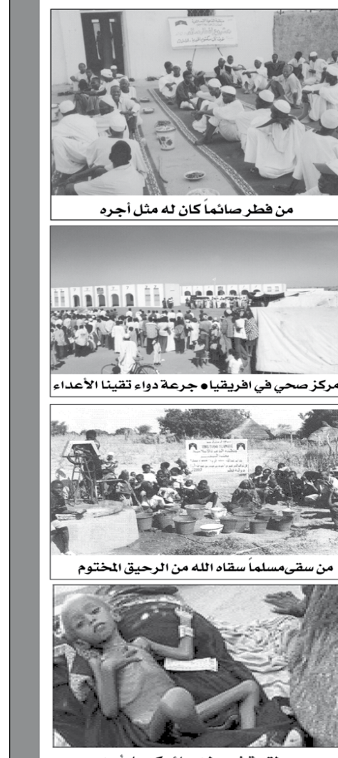
لحمة في بطن جناح كجبل أحد