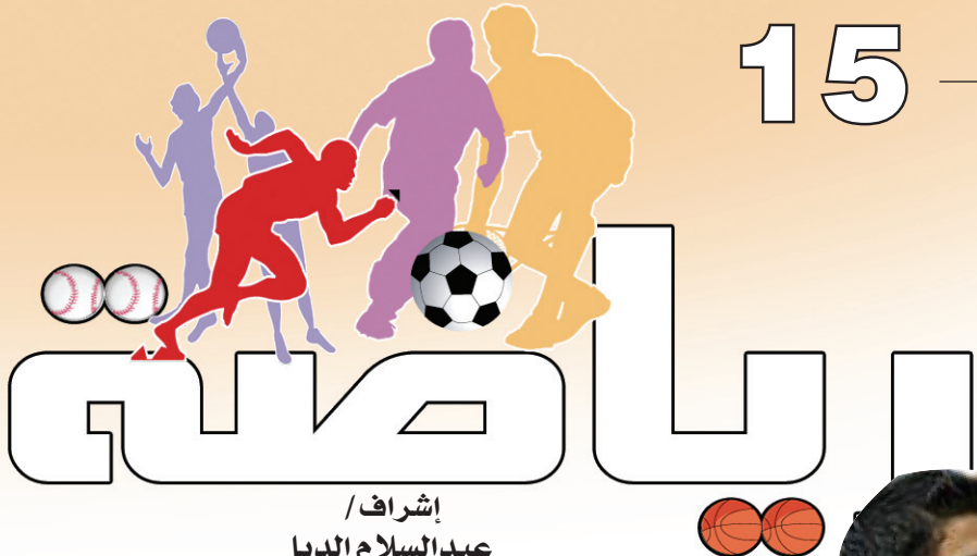
إشراف / عبد السلام الدبا