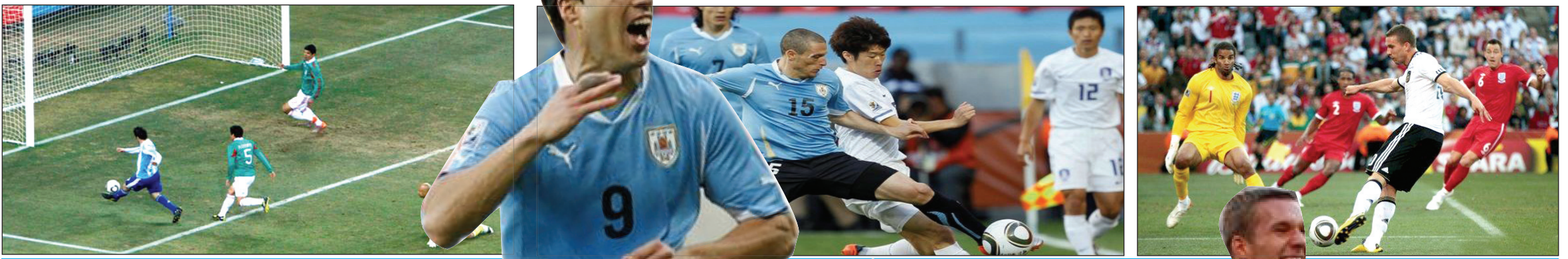
مناقسات دور الـ16 في نهائيات كأس العالم