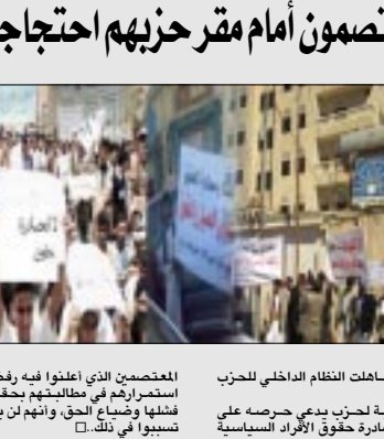
مجلس إدارة حزب الإصلاح