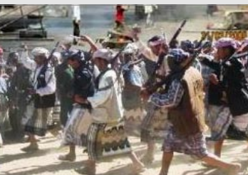
اضطلاع السلطة المحلية بمسؤولياتها

المحذ، وتسخير كافة الإمكانيات المتاحة لها في التنمية بحسب ما هو مخطط لها وحساسة القصرين في أعمالهم. معبرين عن اعتزازهم بمواقف أبناء المحافظة المشرفة عبر مراحل الكفاح المسلح، معبرين عن الثورة وتحقيق الوحدة اليمنية والدماء والدموع، والتوالت في الوطن، كما يوصون بـ «بإلاء» المناضلين من أبناء المحافظة جل الرعاية والاهتمام أسوة بالمحافظات الأخرى.