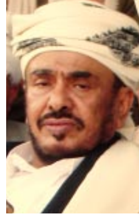
الكيان الذي أعلن عنه الأحد قبل الماضي في العاصمة صنعاء.