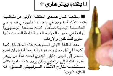
بقلم: بيتر هاري

■ مثلما كان صدق الطلقة الأولى من بندقيته أوتوماتيكية يتردد في أرجاء الوادي في ضواحي العاصمة اليمنية صنعاء، كانت سمعة الجمهورية الواقعة في جنوب الجزيرة العربية ذائعة الصيت بانها مأوى للخاطفين والإرهاب. بعد الطلقة الأولى استوعبت هذه الحقيقة، كما أكدها لي كل تحذير سفر قرأته بعناية قبل أن أقدم للسفر إلى اليمن. دليلي البوي أحمد هدأ من روعي عندما انتبه إلى ارتعابي وكان يريد كلمة عامة كانت مستخدمة خارج الاتحاد السوفيتي السابق: أنه الكلاشكوف.