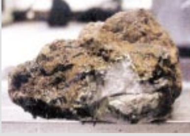
صنعا - الميثاق